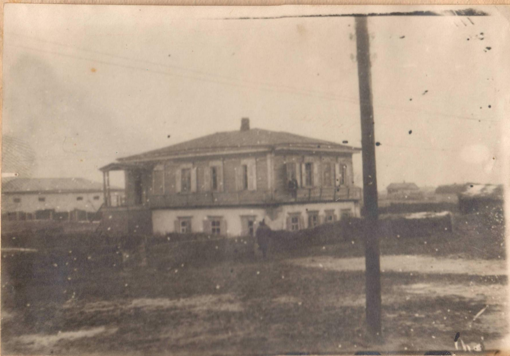
Фотоснимок 1948 года наружного вида здания издательства газеты